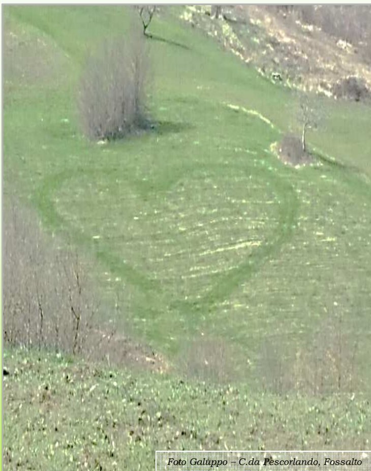
C.da Pescorlando, Fossalto

ARPA MOLISE - C.DA SELVAPIANA 86100 - CAMPOBASSO